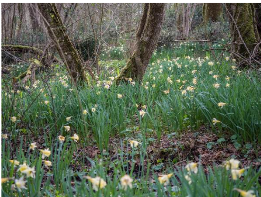
Les abords de la rivière Eau Bourde : floraison de narcisses des poètes à Cestas en mars.